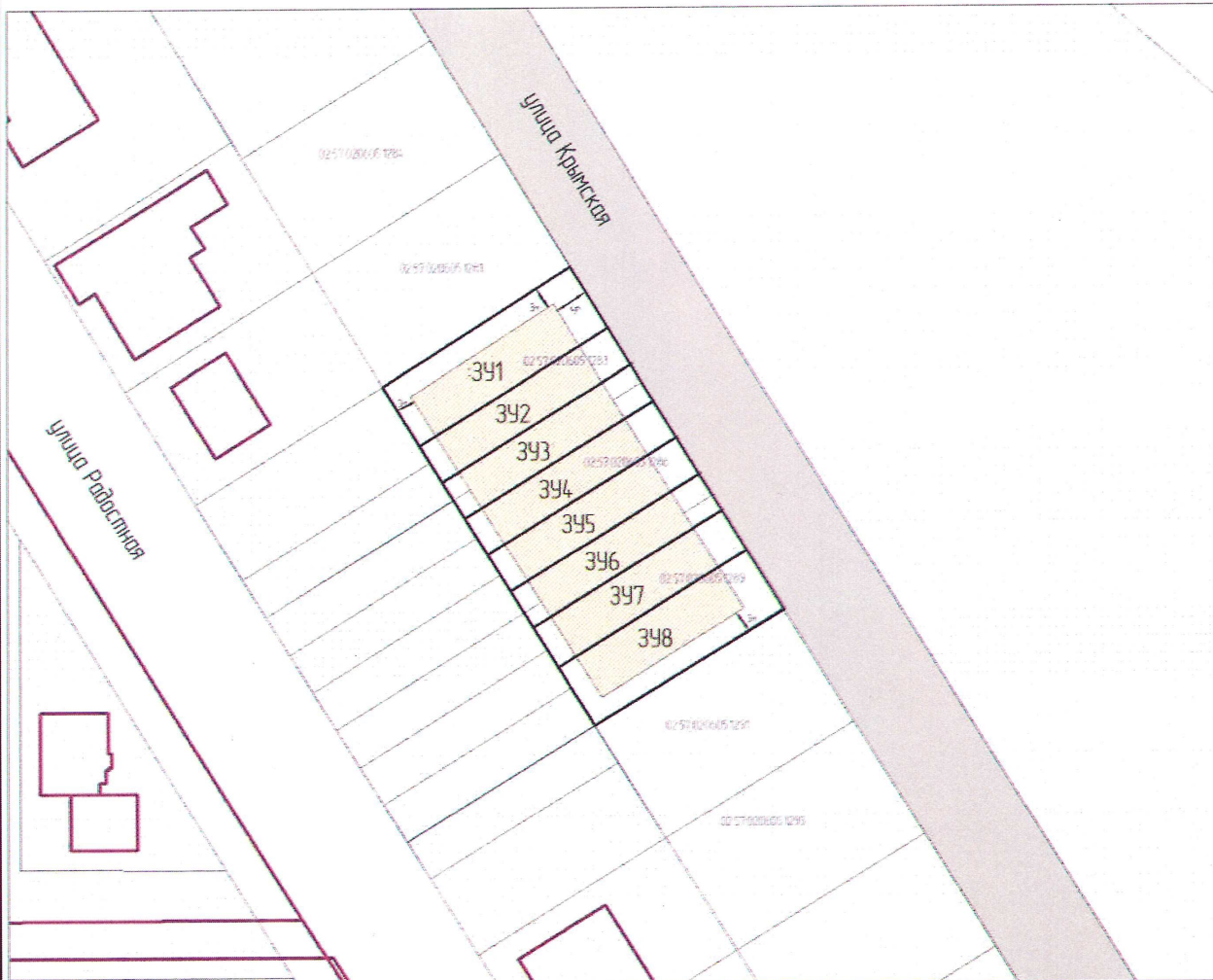
Схема планировочной организации земельного участка